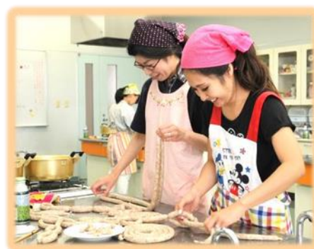
「ソーセージづくり」