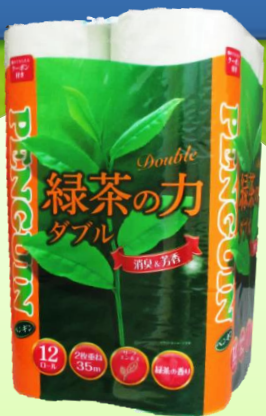
緑茶の力 トイレットペーパー 12ロール