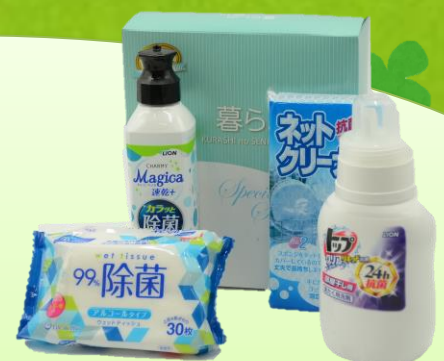
暮らしの 除菌セット