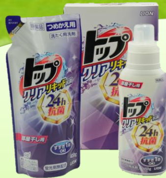
LION トップ クリアキッド