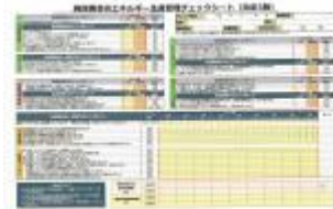
▲省エネチェックシート