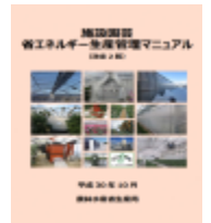
▲省エネマニュアル