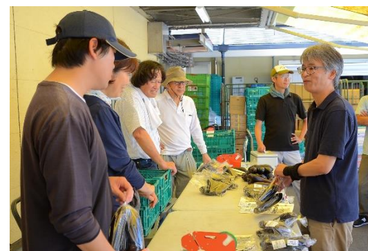
じまん市販売体験