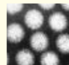
ノロウイルス(拡大)