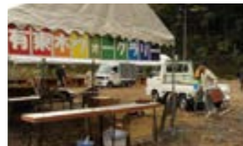
開催準備を行う部農会員

また、部農会活動では管内にある7部農会すべてが協力して、大会の準備運営にあたりました。