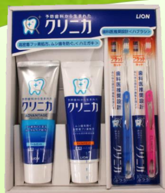
クリニカ 歯磨きセット