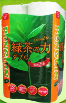
緑茶の力 トイレットペーパー 12ロール

JA静岡市で年金振込を新規でご指定いただいた方に トイレットペーパー12R + 下記2点の中からいずれか1点プレゼント！