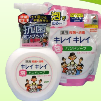
キレイキレイ ハンドソープセット