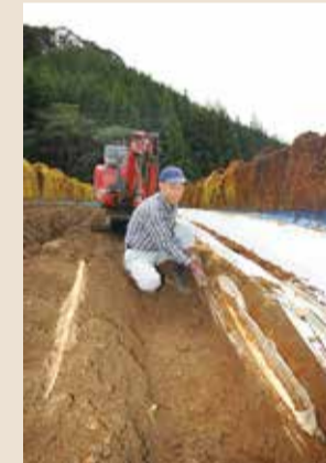
重機で収穫。ビニールに入った自然薯が何層にも現れる。