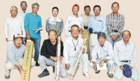
ほんやま自然薯部会の皆さん