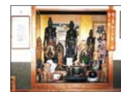
夢に現れたという観音様が安置してある

お水は宅配やオンラインショップでも買うことができます。でも一番お得なのはお店!なんと10ℓ350円。足を運んでくださるお客さまに「安全でおいしい水を安く飲んでいただき元気になってもらいたい」と先代からの思いを受け継いでいます。土日は地元農家の野菜も並ぶそうなので、ぜひ足久保の自然を満喫しながら訪れてみてはいかがでしょうか。