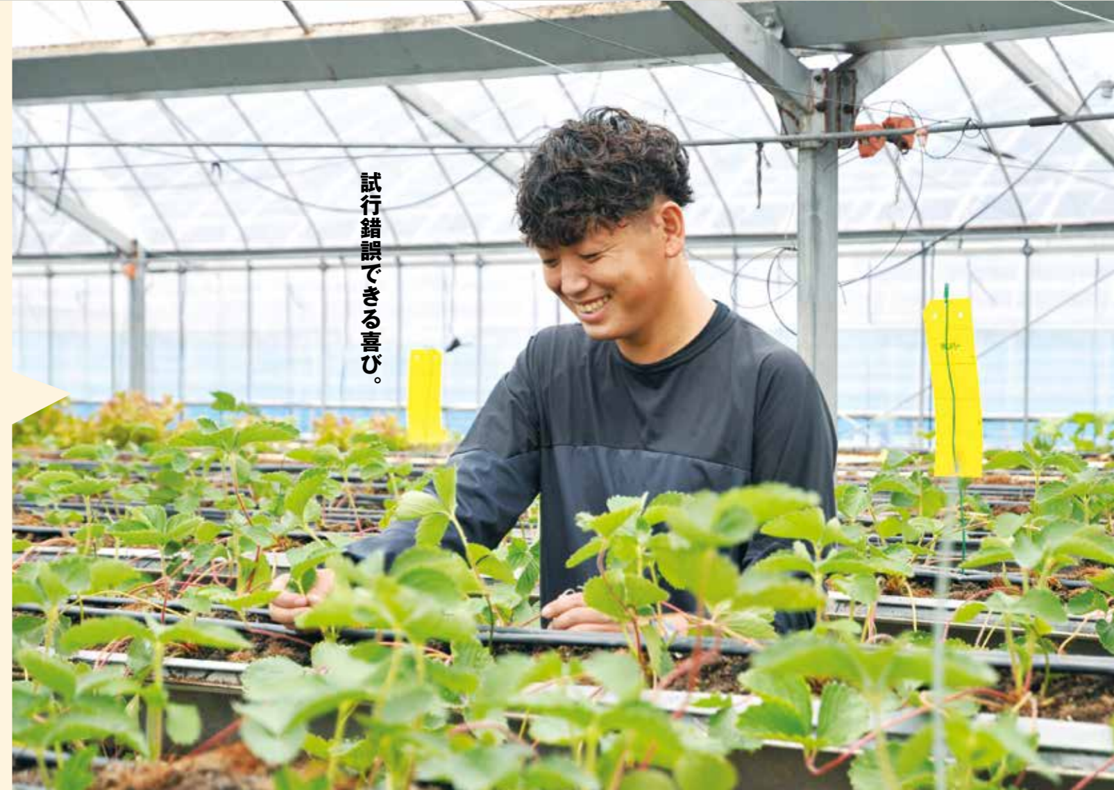
試行錯誤を繰り返す。