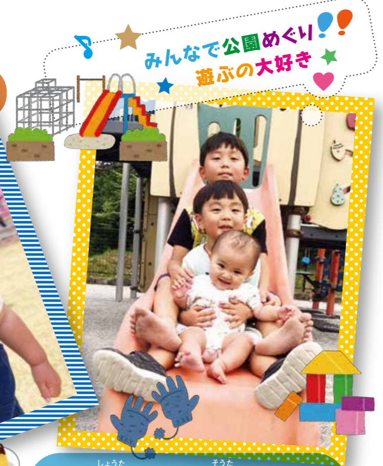
みんなで公園めぐり! 遊ぶの大好き