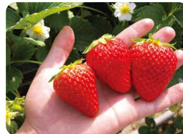
真っ赤に実った「紅ほっぺ」