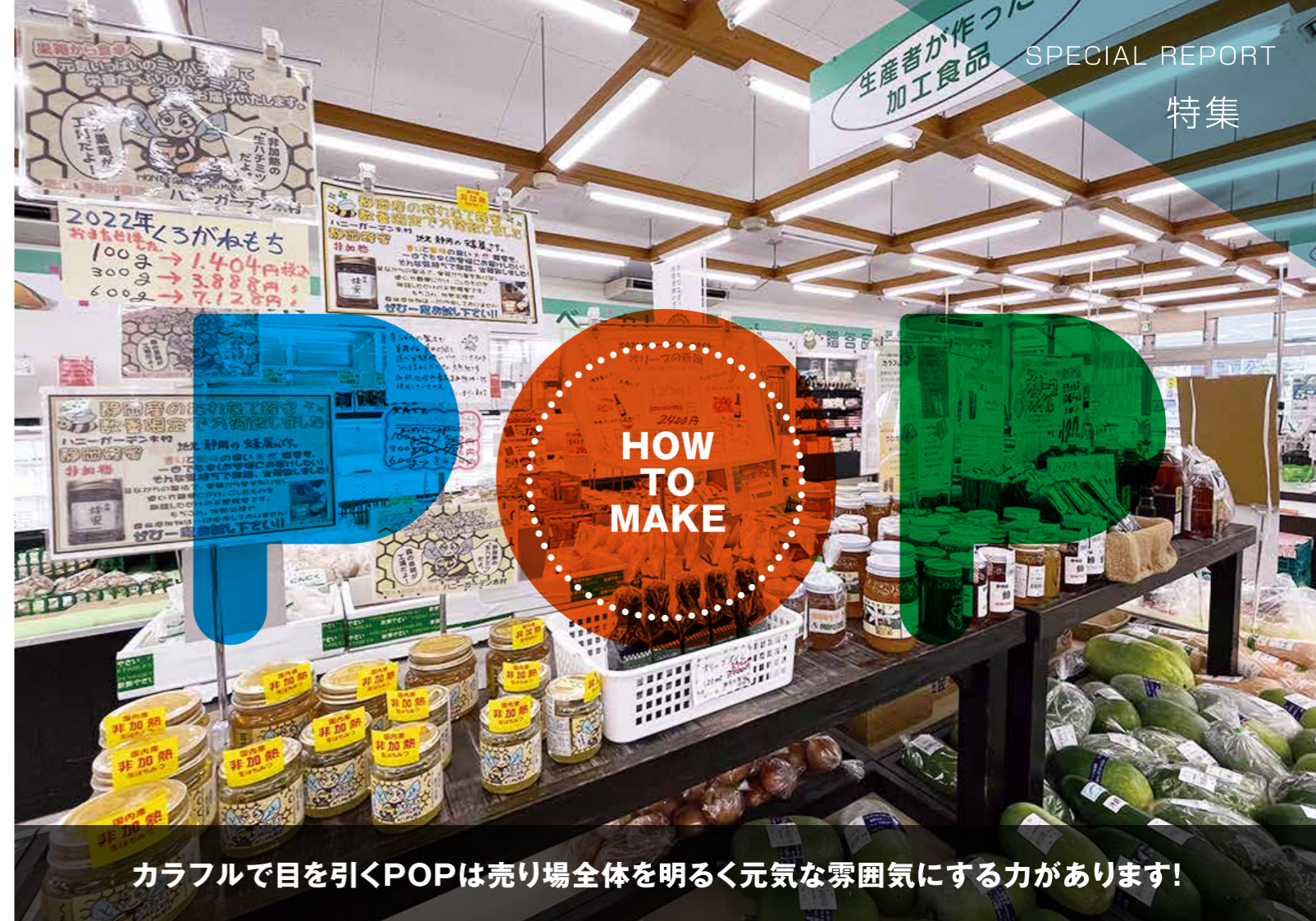
カラフルで目を引くPOPは売り場全体を明るく元気な雰囲気にする力があります!