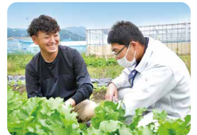
東部営農経済センター片井職員と