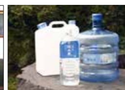
飲用はもちろんお茶、炊飯、お子さまのミルクにも